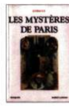
LES MYSTÈRES DE PARIS Eugène Sue