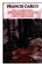
ROMANS Francis Carco