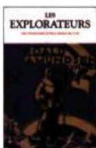
LES EXPLORATEURS DES PHARAONS à PAUL-ÉMILE VICTOR

Dernier détail, mais d'importance : compte tenu de la qualité, de l'intérêt et de l'originalité (ainsi que du volume) de chacun des titres de la collection Bouquins, leur prix de vente tient de l'aubaine. ■