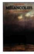
MÉLANCOLIES DE L'ANTIQUITÉ AU XX e SIÈCLE Yves Hersant