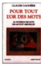
POUR TOUT L'OR DES MOTS Claude Gagnière