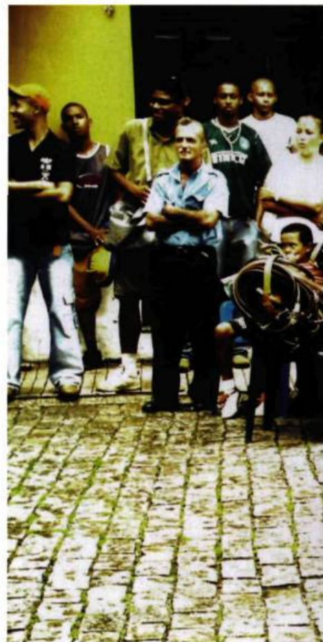
Marché public, Brésil.

« Je ne suis pas très inspiré par ce qui se passe ici ; le climat socio-politique actuel ne m'inspire vraiment pas », admet ce baby-boomer déçu. Son second roman, L'Âme frère , avait un cadre québécois... mais au 17 e siècle. La distance, géographique ou temporelle, semble nécessaire à l'écrivain. « J'ai besoin de travailler sur l'ailleurs. Mon pays, c'est aussi la langue, d'une certaine façon. Actuellement, je travaille sur deux romans : l'un se déroule