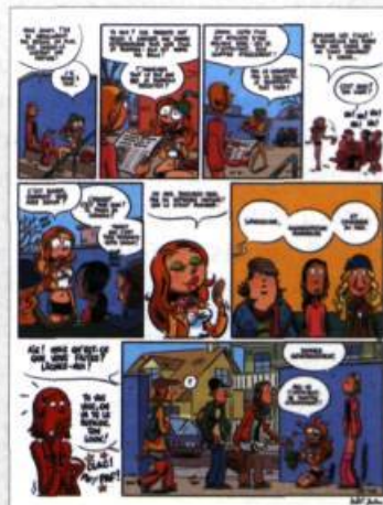
Planche extraite de l'album Les Nombriels , Dupuis, 2006