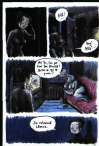
Planche extraite de l'album Appalaches, Colosse , 2007