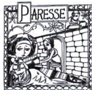
Planche extraite de l'album Mademoiselle , tome 3, Les péchés capitaux , Marchand de feuilles, 2007