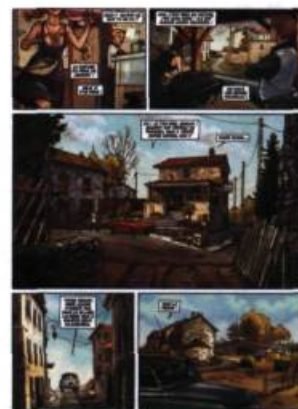
Planche extraite de l'album L'été 63 , à paraître en 2008 aux éditions Vents d'Ouest