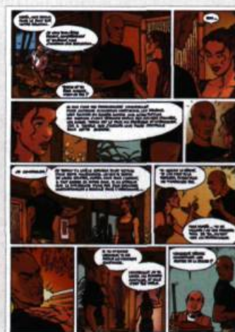
Planche extraite de l'album Moréa , tome 4, Un parfum d'éternité , Soleil, 2005