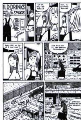
Planche extraite de l'album Paul en appartement , La Pastèque, 2004