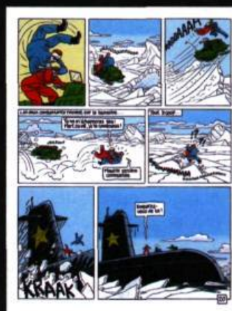
Planche extraite de l'album Kamarade Ultra , série Red Ketchup , Dargaud, 1991