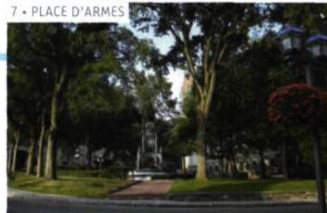
7 • PLACE D'ARMES

monter le grand escalier, parcourir la promenade des Gouverneurs jusqu'à la Citadelle qui est située au début des Plaines, si le cœur vous en dit. Vous pourriez aller au bout du monde... »