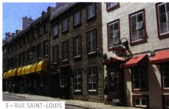
3 • RUE SAINT-LOUIS