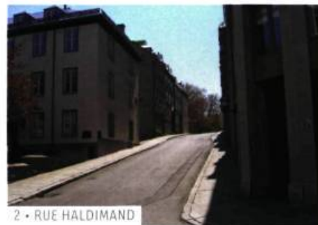
2 • RUE HALDIMAND

« L'espace de quelques instants, tout le Vieux-Québec m'apparut comme un livre d'images anciennes et je me laissai glisser lentement dans la rue Haldimand parmi les vieilles maisons et les souvenirs qui se levaient dans ma mémoire. Je saluai au passage l'Hôtel du Gouverneur et ma carrière de garçon de table qui n'avait duré qu'une seule journée d'été. »