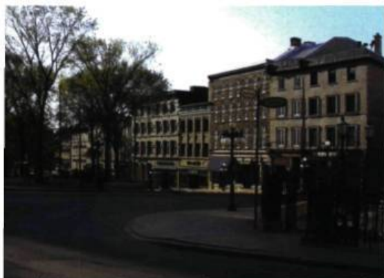
4 • AXE DES RUES BUADE, DE LA FABRIQUE ET SAINT-JEAN

« Je traversai la rue Sainte-Anne qui répandait toujours une persistante odeur de crottin et j'obliquai à droite au coin de la rue Buade ; je fis