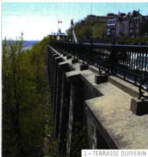
1 • TERRASSE DUFFERIN

En convalescence après qu'on lui a greffé un cœur d'adolescente, un écrivain chasse l'ennui en arpentant les rues de son quartier. Un jour, à la librairie Garneau, il croise une toute jeune fille qui tient sur son cœur un livre sur les oiseaux. Charlie, surnommée la baleine bleue parce qu'elle respire fort dans son sommeil, fascine l'écrivain. Qui est cette enfant aux allures de garçon? Pourquoi la suit-il à travers le dédale des vieilles rues? Vit-elle ailleurs que dans son imagination? C'est l'histoire d'un homme qui découvre à la fois la douceur et la fragilité de la vie. Et celle d'un écrivain littéralement amoureux de son quartier, le Vieux-Québec. Ouvrez le roman à la page 15. Point de départ, la terrasse Dufferin.