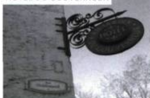
HÔTEL DU GOUVERNEUR