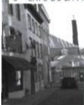
3 • CAFÉ DE LA PAIX

« Très lentement la vérité se fit en moi, fragile et vacillante d'abord, puis tout à coup éblouissante : mes souvenirs m'avaient guidé parmi les rues, comme le sang dans les artères, jusqu'à cette rue de la Fabrique qui était le cœur du Vieux-Québec, et ce cœur était lui aussi un cœur féminin. »