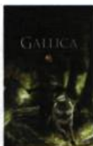
GALLICA : l'intégrale de la trilogie Bragelonne, 2008

finies, explique Loevenbruck, traduit en 12 langues. Sauf en anglais, où la french fantasy est peu connue », s'empresse-t-il de préciser.