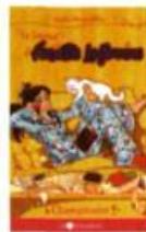
LE JOURNAL D'AURÉLIE LAFLAMME, Tomes 1 à 5 Les Intouchables, 2006 à 2008