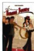
LES AVENTURES D'INDIA JONES Les Intouchables, 2005