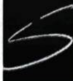
ILLUSTRATION : POLYGONE STUDIO (CARL PELLETIER)

SOULIÈRES ÉDITEUR www.soulieresediteur.com