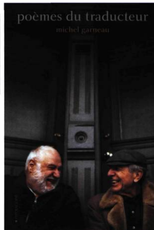
LEONARD COHEN LIVRE DU CONSTANT DÉSIR (2007) ÉTRANGE MUSIQUE ÉTRANGÈRE (2000) Traductions de Michel Garneau

Lorsqu'on a par la suite proposé à Garneau de traduire Book of Longing , le plus récent recueil de Cohen, l'en-