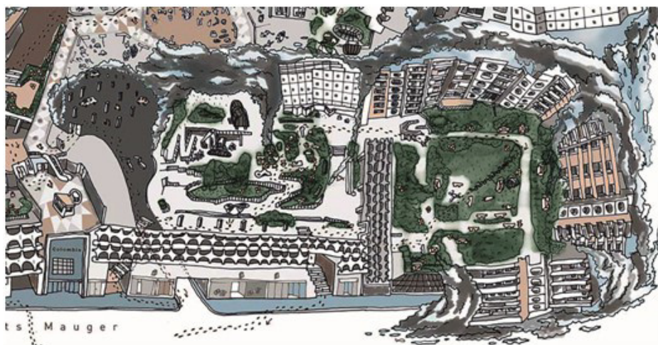
Figure 1. Mathias Poisson, Entre les dalles , Rennes, 2009. Impression offset, 55 x 60 cm. (Source : Poisson, n. d., p. 12).

place plusieurs lectures de textes suivant différents itinéraires, une sorte de bibliothèque ambulante offrant au public la possibilité de vivre cet espace narré qui mélange espace géographique et livresque. Par rapport à sa démarche de recherche et à sa pratique d'artiste marcheur, Poisson emprunte aussi à la géographie la carte comme objet scientifique, à la fois ressource plastique et conceptuelle, afin de la détourner et de se saisir des « interstices de la ville » par ses « partitions de promenades » (Poisson, 2009). Il s'agit de raconter l'espace urbain et de rendre visible cette expérimentation sensible de la promenade en réalisant des cartes présentant leurs propres règles, afin de procurer une impression de mouvement au lecteur et un éclairage sur le lieu traversé (voir des exemples de cartes aux Figures 1 et 2).