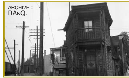
ARCHIVE : BANQ.

L’intrigue est campée dans un quartier ouvrier francophone de Montréal. La BANQ possède une archive photographique de la maison de la rue Saint-Augustin, décrite par l’écrivaine et qui, aujourd’hui quasi méconnaissable, est une halte pédestre du circuit littéraire Bonheur d’occasion dans Saint-Henri .