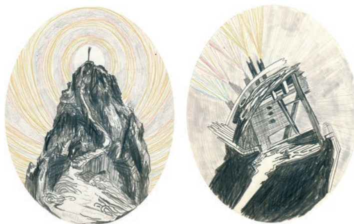
Amélie Laurence FORTIN, Caltras & Notus , 2012. Divers crayons sur papier/Various pencils on paper. 17 x 11 cm encadré- framed. Détail de Hawaï.