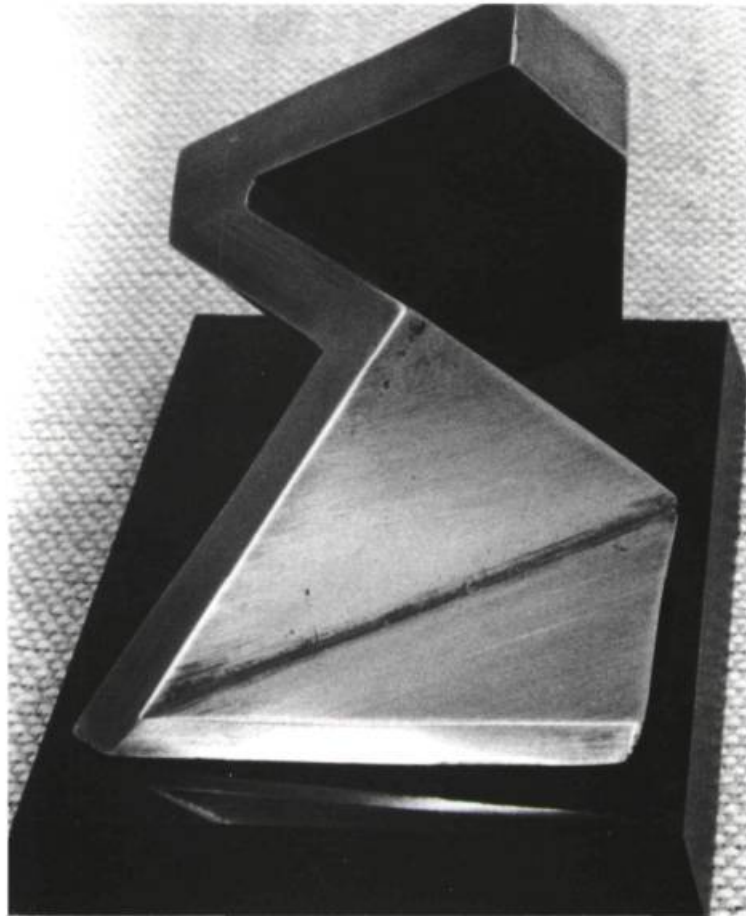
Mur fermé et ouvert #28, 1971