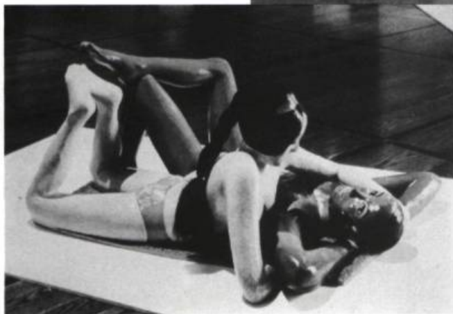
À gauche: Claire Hogenkamp, Sunworshippers , 1968, acrylique peint, 22-1/2 x 53 x 36". Ci-dessus: Brigitte Radecki, "En transformation" , matériaux divers, 1985.

Parler d'un apport spécifique ou non spécifique des femmes à la sculpture en cette fin de décennie 80 est-il encore possible sous l'angle d'une discipline dont on ne peut plus faire le tour, comme antérieurement on faisait le tour des sculptures? Est-il encore possible de parler sculpture sans se demander: "qu'est-ce que la sculpture aujourd'hui?" et le corollaire: "qu'est-ce que la sculpture n'est plus aujourd'hui ou du moins qu'est-ce qu'elle n'est plus exclusivement?"