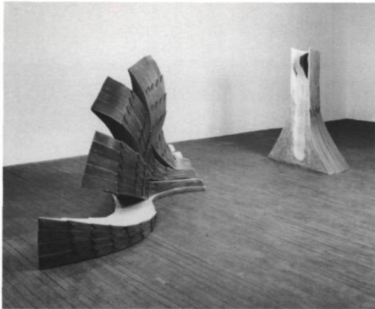
Danielle Sauvé, "Dryade ou les lieux de l'envoûtement", 1987. Bois, plâtre, acrylique, colorant, (hauteur) 150 cm x (largeur) 110 cm x 80 cm (tronc); 140 cm x 110 cm x 310 cm.

culturels, politiques -, conditionnements qui ont structuré nos contextes de vie et nos connaissances, nos sensibilités surtout. Leurs auteures sont des sculpteuses mais elles s'approchent de l'architecte pour ce qui est de l'aménagement de l'espace physique, psychologique et conceptuel.