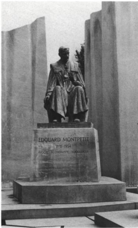
Sylvia Daoust, Monument Édouard-Montpetit, bronze 1967, Université de Montréal