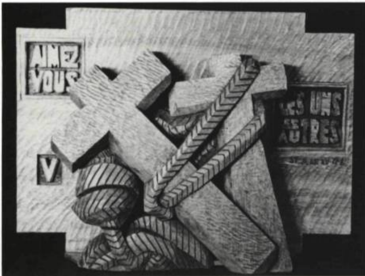
Marie-Anastasia, Chemin de croix, 5e station. Acajou, H. 14" 1953-54

Simon aide Jésus à porter sa croix. Le lien d'amitié entre les deux personnages est symbolisé par le cable de charité .