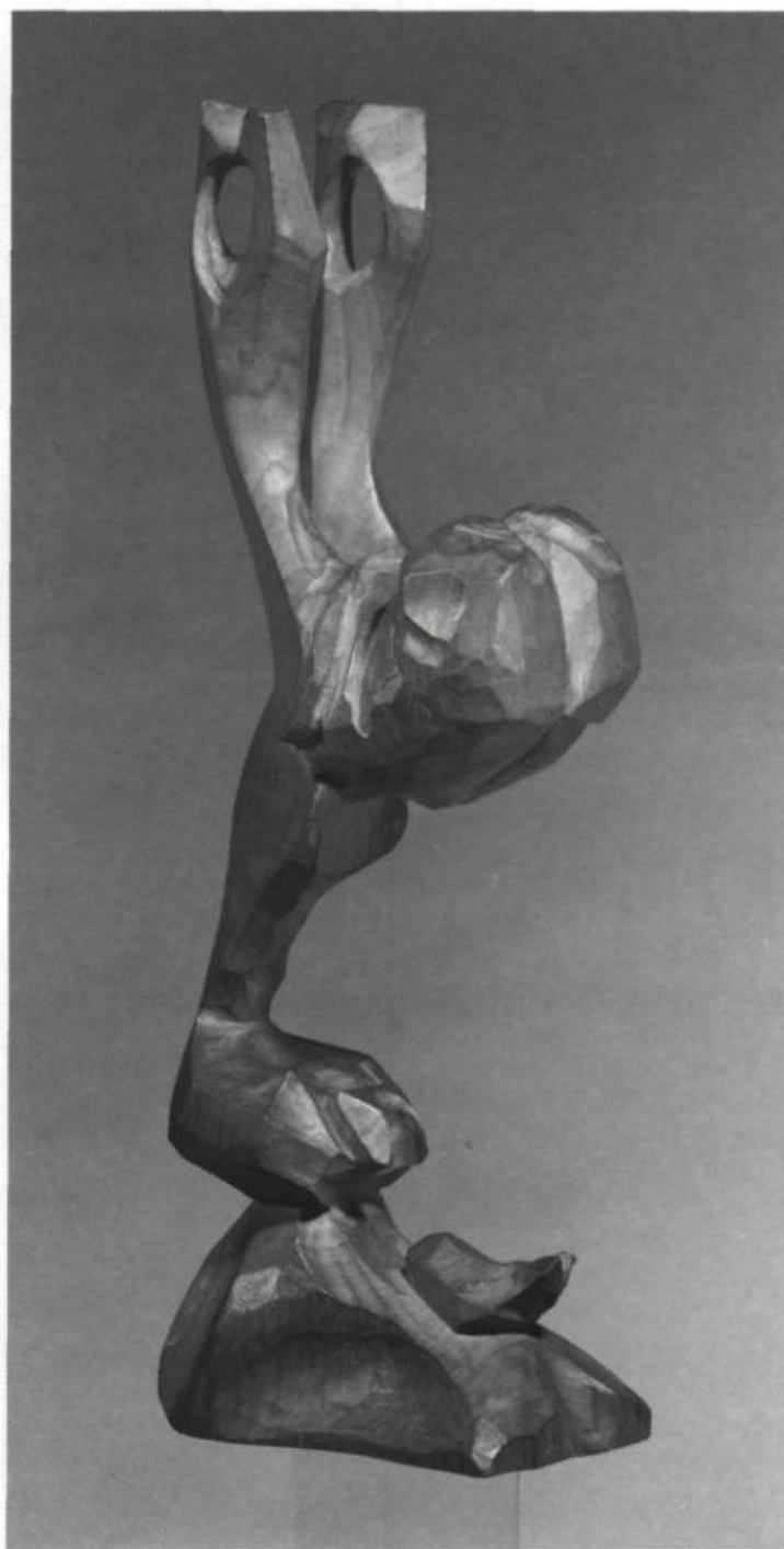
Paul-Émile Borduas, États-Unis, bois, 29,9 X 6,5 X 10,5 cm, 1951. Musée des beaux-arts du Canada.

S'il ne s'agissait donc pas d'un domaine totalement inconnu de lui, il n'en reste pas moins qu'en 1951, la sculpture constituait un nouveau champ d'exploration pour Borduas. Trop de temps s'était écoulé entre ses premiers exercices et les sculptures qui l'occupaient maintenant, pour qu'un rapprochement entre les uns et les autres soit très éclairant. Aussi bien, nous croyons que c'est plutôt dans son activité picturale immédiatement antérieure qu'il faut chercher la clé de ce soudain détour par la sculpture. 1950 et 1951 sont marquées dans le développement pictural de Borduas comme des années où il pratiqua beaucoup l'aquarelle, l'encre, la gouache, donc les médiums à l'eau. Dans ses "aquarelles", Borduas avait découvert les vertus expressives du papier sur lequel se détachaient les "objets". Même sans intervention, ce support évoquait l'espace infini. N'était-il pas logique ensuite de chercher à découvrir la qualité expressive des "objets" eux-mêmes en les détachant pour ainsi dire de tout support et en les traitant en trois dimensions non plus dans l'espace fictif de la peinture mais dans l'espace réel de la sculpture? Il me semble que c'est la raison principale qui amena Borduas à la sculpture, et c'est aussi la raison qui l'en détacha peu après. Bientôt, en effet, la peinture (à l'huile) reprenait ses droits et dans les tableaux de Provincetown,