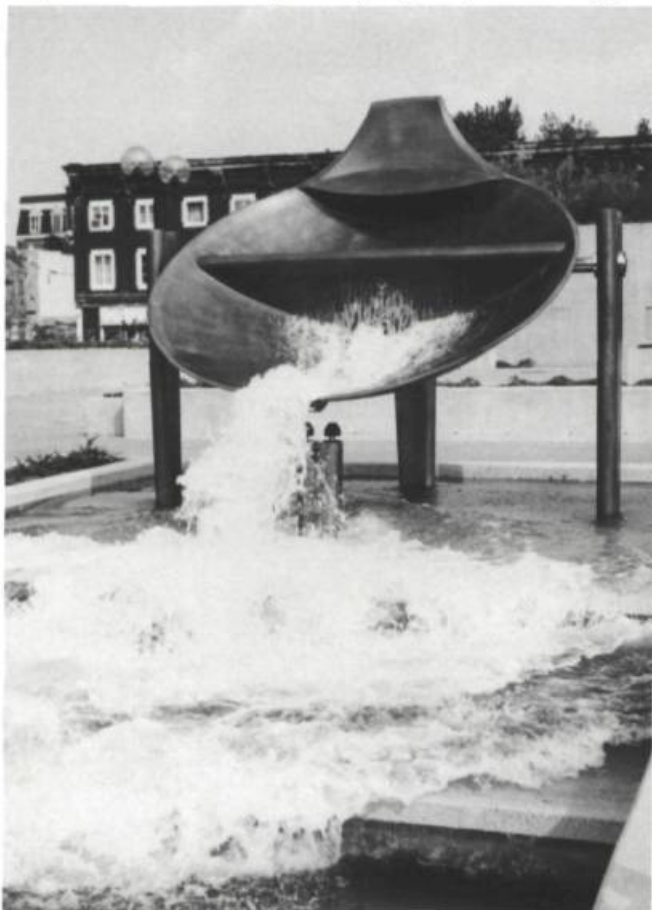
Charles Daudelin, Mastodo , bronze, 2,90 X 3,65 X 3,96 m, 1984. Square Viger. Vasque basculante commandée par l'eau (350 gallons).

Depuis la mise sur pied par le gouvernement du Québec du programme du 1%, c'est-à-dire l'«Intégration des arts à l'architecture et à l'environnement des édifices du gouvernement du Québec», certaines réalisations, obligatoirement commandées et financées, deviennent possibles à l'échelle de la ville.