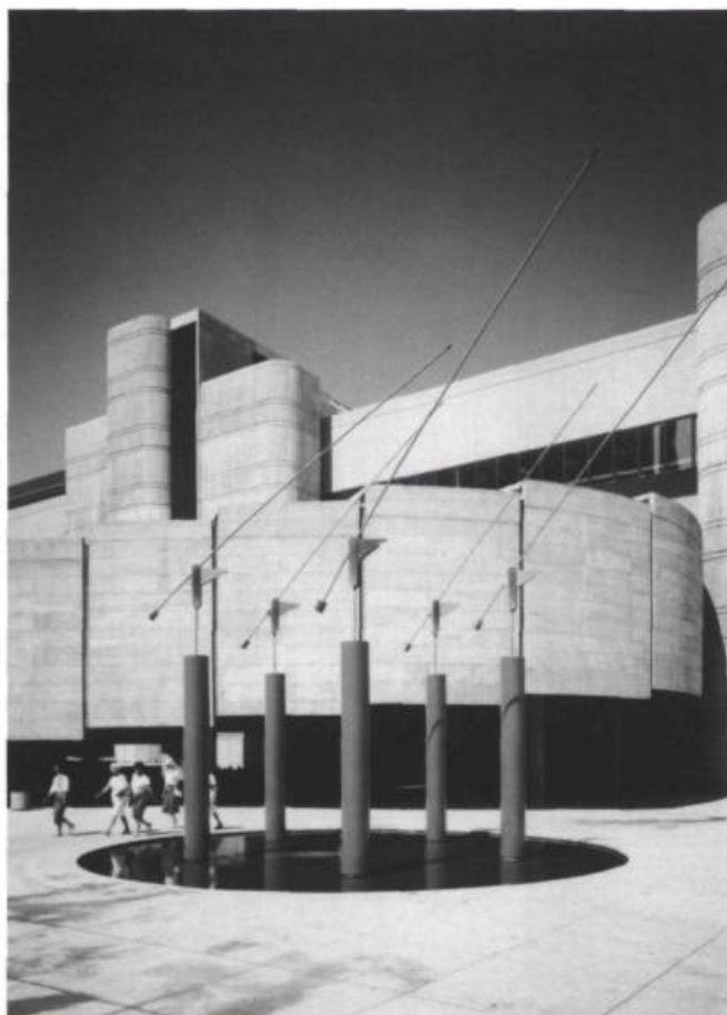
Charles Daudelin, Éolienne 5 , 1983. Palais des Congrès. Tubes en acier peint de 3,7 m surmontés de tiges mobiles en acier inoxydable de 6 m de longueur sur pivots amortisseurs.