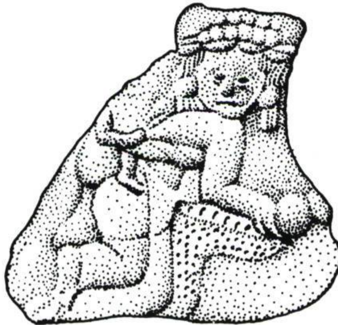
Femme moulant du maïs sur un metate, avec son petit sur le dos. Figure classique tardive de Lubaantun, Bêlize, Amérique Centrale. D'après N. Hammond, Ancient Maya Civilization . New Brunswick, N.J., 1982, p. 184.

Dans l'un et l'autre cas, l'artiste entendait garder trace de la genèse de son oeuvre même finie de manière à ne pas faire oublier sa présence de créateur dans l'objet. David Smith de