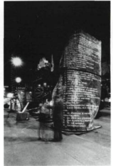
Armand Vaillancourt, Paix, Justice et Liberté , 1989. Acier, techniques mixtes. App. 50' x 20' x 15'.

prévoyait pas cette possibilité et les sculpteurs trop concentrés sur leur création n'avaient pas le temps pour s'occuper de cette question. Cependant, on pourra peut-être voir les sculptures de Beaumont, Darby et Fortier dans des lieux publics si des offres d'achat proposées pendant le projet se concrétisent. C'est à souhaiter. Les dimensions de ces oeuvres en ont permis le transport à la fin du projet. Armand Vaillancourt a décidé quant à lui de faire les démarches nécessaires auprès des autorités municipales afin de laisser sa création, incontournable il faut le dire, sur place au moins jusqu'à la fin de l'été. Je souhaite vivement que de tels projets se répètent, permettant en cela aux artistes d'habiter la ville et de faire partager à leurs concitoyens leurs visions et leur recherche.