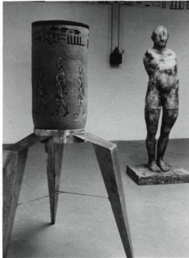
Michaud-Blais, Noces de Cana , 1989. Terre et métal. 7'h. (personnage).