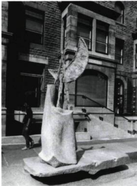
Serge Beaumont, Tentelune , 1989. Pierre de St-Marc. App. 10' x 4' x 4'.

ciale, dénonciatrice des marasmes écologiques causés par la folie militariste, sa sculpture-installation est un assemblage pouvant paraître à première vue hétéroclite, mais si chargé de sens que le tout devient rapidement homogène tant dans la forme intrinsèque de l'oeuvre que dans sa relation spatiale avec l'environnement urbain. Formée de multiples éléments de grandes dimensions reliés par des câbles en tension (parties de citernes, éléments de pylônes assemblés en arche) l'oeuvre s'étend, par un ensemble de plaques posées sur l'asphalte sur lesquelles les automobiles passent, jusque de l'autre côté de la rue. Véritable dazibao, la sculpture est ponctuée de textes peints sur l'acier: dénonciation exhaustive d'une trentaine des "industries de la mort" de la région métropolitaine, extraits d'un texte de Pierre Vallières faisant état de statistiques quant aux effets déplorables des dépenses militaires sur l'écologie; en