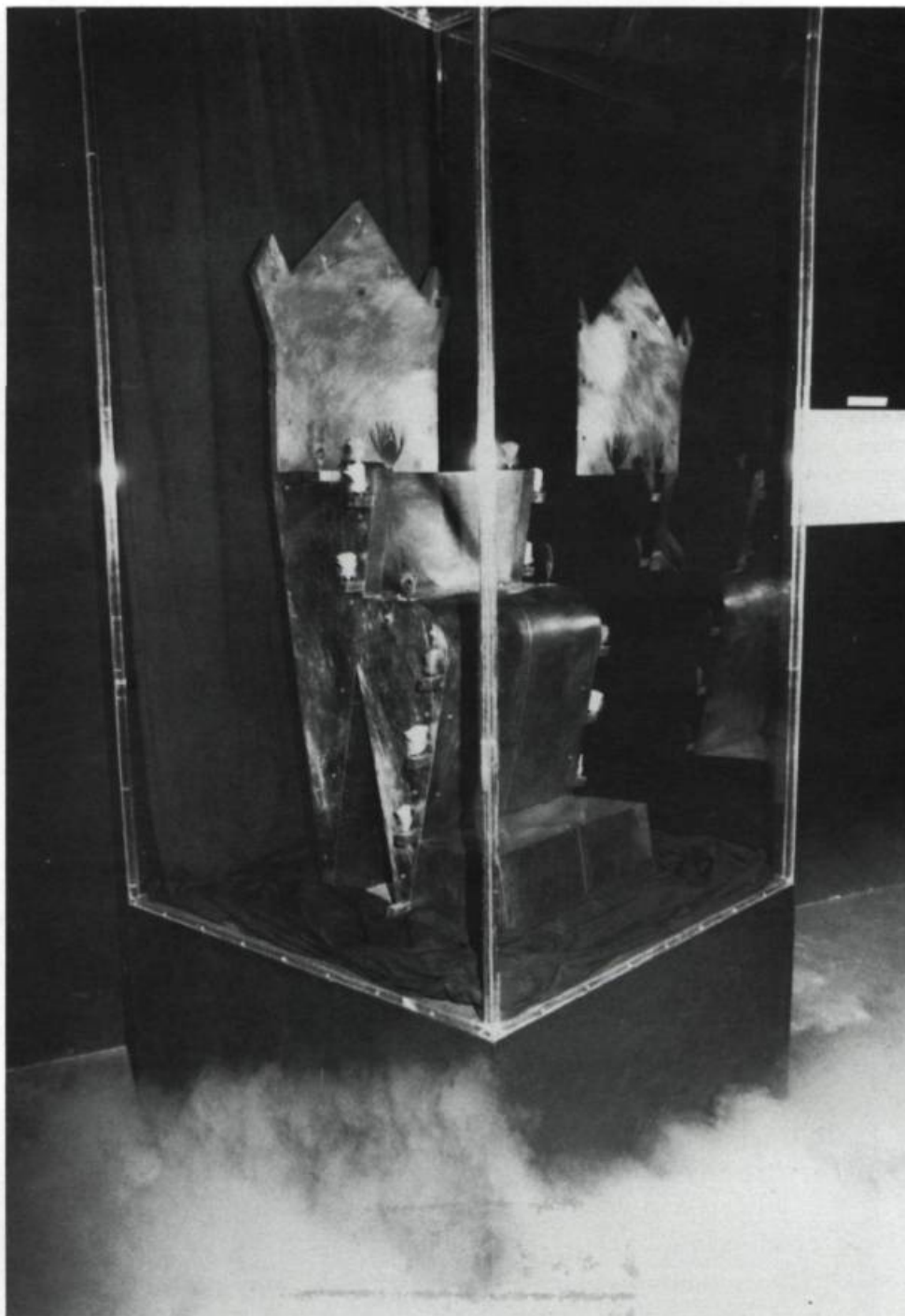
Daniel Hogue, L'Assomption du trône , 1989. Cuivre, plumes, supraconducteurs, aimants et azote. Sculpture exposée à la Cité des Arts et des Nouvelles Technologies de Montréal dans le cadre de "Image du futur 89".

La sculpture : j'ai voulu parler de façon ironique de rois déchus, enfermés, glacés dans le pouvoir qui les traque. De monarchies éclatées. D'un projet de musée qui a traversé les âges, reposant figé sous son enveloppe de verre. Du héros exemplaire moderne autrement maquillé : en révolutionnaire, en réformateur, en chef de parti. De l'homme de tous les jours face aux mythes du surhomme... Mais aussi de