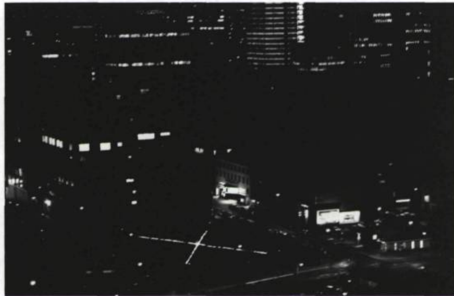
André Fournelle, Fires in your cities , 1983. Événement performance, rue Bleury, Montréal. Feu. 60,9 x 60,9 m.

Indépendamment des intentions de l'artiste qui a vécu et travaillé en Angleterre et en Italie, tout visiteur, sans le savoir (puisque l'oeuvre elle-même ne suggère aucun indice à ce fait biographique) rend à l'artiste le profil d'une mémoire découpée dont n'est livrée que l'image des frontières transformées et étendues, dans la mesure où la pluralité même des îlots évoque la forme d'un archipel. C'est un peu comme si l'artiste se retirait généreusement de son habitat pour laisser le visiteur produire son propre itinéraire et, plus encore, lui accordait la permission de poursuivre un parcours sans