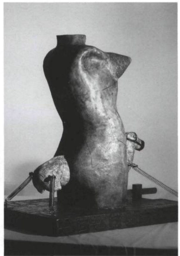
Noces de Cana, What ever happened to Coco Chanel during the war, ou Basse couture , 1990. Céramique et métal. 81 x 75 x 54 cm. Sélectionnée pour La Bourse du Printemps de l'Université du Québec à Montréal.