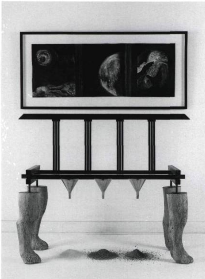
Dominique Valade, La louve , 1994. Acier, pierres calcaires, entonnoirs, sable. Au Mur : photographies n/b rehaussées de pastel. 180 x 120 x 60 cm.