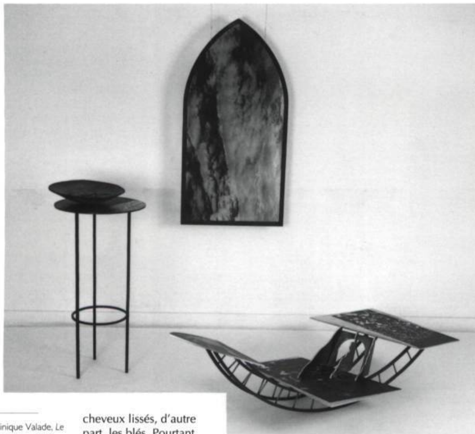
Dominique Valade. Le cours de l'eau , 1994. Acier, aluminium, céramique, fenêtre, film transparent, photographies. 220 x 200 x 200 cm.

Suivant inévitablement le courant, l'humain, l'embarcation et l'eau se confondent à l'intérieur d'une même forme qui repose au sol, dans Le cours de l'eau . Par la photo et le travail en surface, j'exploite quelques qualités esthétiques de l'eau : son opacité, le mouvement du courant (projeté dans la foule), et ses jeux de réflexion (car l'eau regarde et reflète le ciel). La main veinée lie l'eau et l'humain. Tout près, par une fenêtre de forme architecturale gothique, d'où un nuage en transparence est tourné à la verticale, nous pouvons entrevoir la trame d'un paysage urbain réel.