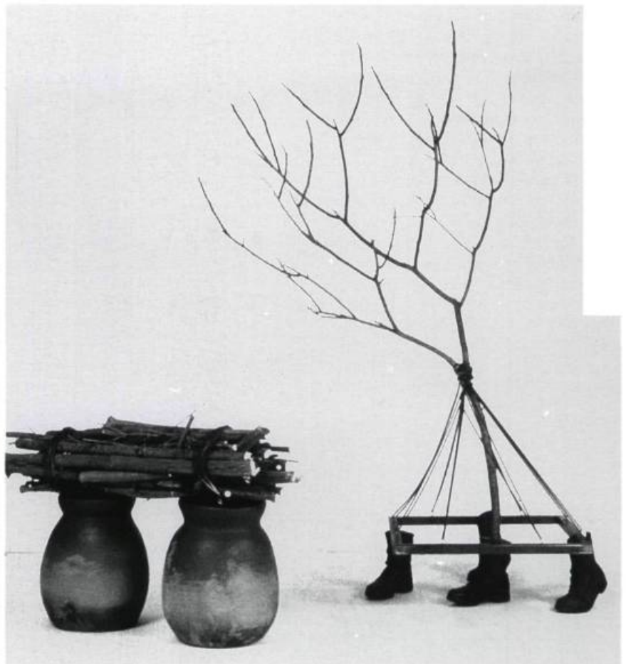
Dominique Valade, La forêt et le porteur , 1994. Acier, résine, arbre, céramique, branches. 220 x 360 x 360 cm.

qui deviendront lieu de communication et d'interprétation. Ces fragments prélevés synthétisent un moment situé entre l'intention première et le doute vers lequel ils se destinent. L'exposition ne peut parler du destin des choses et de l'homme sans réfléchir sur le type d'intervention et la pratique artistique, revoir le cheminement de l'oeuvre de