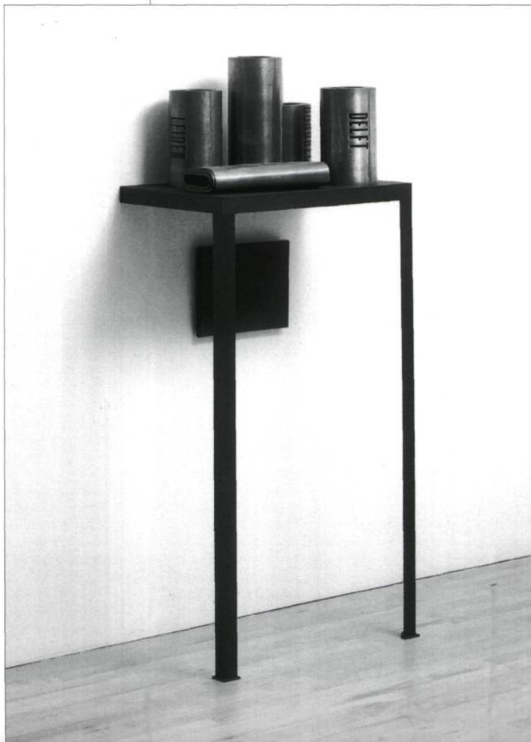
Pieter Laurens Mol, Hollandse Lijfrenten/Dutch Annuities , 1991. Lettrages sur 5 rouleaux de plomb, console en acier, coton bleu sur faux cadre / Letterpress on 5 rolls of lead, steel pier table, blue cotton on stretcher. Dimensions du panneau / Panel size : 24 x 30,3 cm; l'ensemble/overall size : 152 x 62 x 43,2 cm. Wilhelm Peppler, Paris.

My first introduction to Pieter Laurens Mol was in 1987 at the Montreal Museum of Contemporary Arts where I witnessed his extraordinarily inspiring The Anonymous Testimony . Graven into my memory are the stacks of tiles, the iconic picture of a crow, the pervading odor of melancholy... Here were two seemingly contradictory themes, beauty and death, occupying the same stage, partaking of the same installation. The syncretic mix of the tiles's patina, their history, their volumetric contrast with the paper crow, everything evoked the passage of