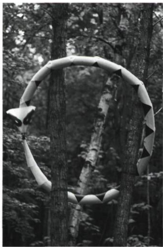
Richard Dautre, Ouro Boros , 1997. Fibre de nylon, plastique. 0,15 x 2 m. diam.