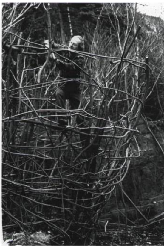
André Du Bois, À l'abri / à découvert , 1997. Bouleau jaune. Œuvre in progress. Approx. 10 x 5 x 5 m.

tution. Le geste de créer des œuvres, de les exposer relève, chez lui, de la stratégie guerrière : une manière à vrai dire de prendre les armes et d'aller au combat. Attaquer certes, mais aussi se défendre parce qu'on se sent fort démuni lorsqu'on est un "jeune artiste perdu dans le Bas-du-fleuve", parce qu'on veut lutter également pour qu'un regroupement d'artistes — Au bout de la 20 — ne meure pas (suite aux coupures budgétaires dont il a été l'objet). Alors Sénéchal installe son "repaire des opimes" devant un lieu officiel de la culture et du pouvoir. Des opimes sont les armes que le vaincu cède au vainqueur après la bataille. Des armes faites de bois flottants échus sur la grève, transformés désormais