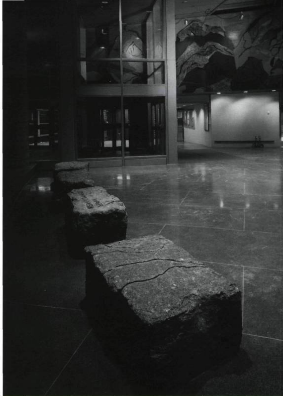
Françoise Sullivan, Montagnes , 1997. Détail. Onze variétés de granit. Hall du pavillon Président- Kennedy, Université du Québec à Montréal.

Francine Jacques, Service de l'information et des relations publiques, UQAM.