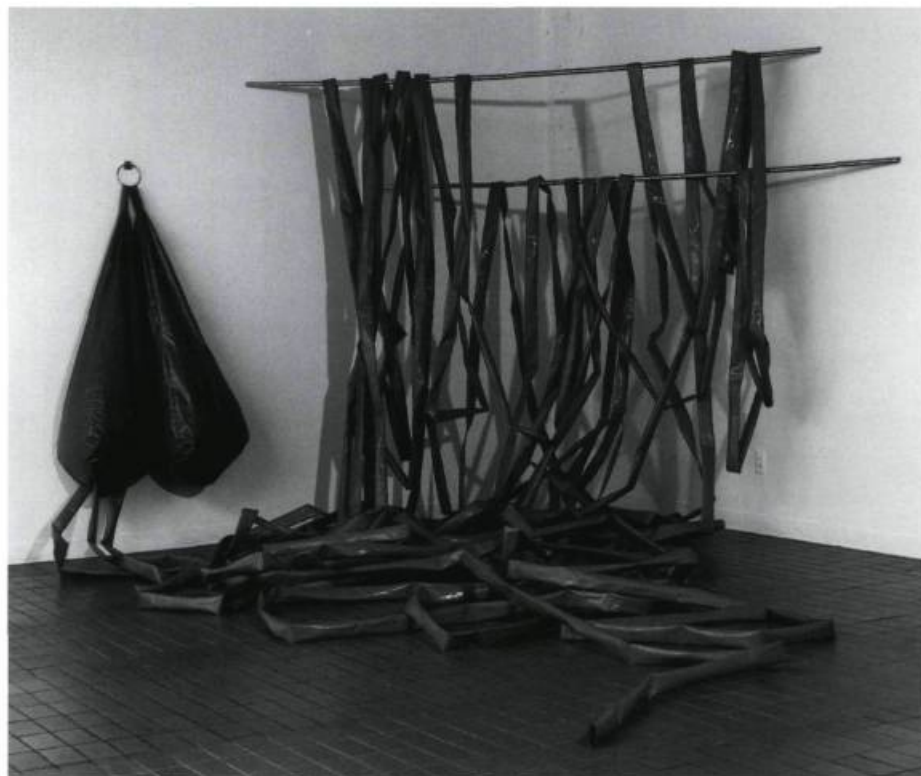
Cozic, Complexe mammaire , 1970. Installation, Plein sud, centre d'exposition et d'animation en art actuel à Longueuil. Vinyle et métal, deux tubes de métal, 3,1 m long; deux sacs de vinyle, 1,3 m haut; trois tubes de vinyle, 13,7 m long; un tube de vinyle, 10,5 m long. Collection : Musée des beaux-arts du Canada, Ottawa.

La fin des années soixante, internationalement, se montre propice à l'association duale comme création d'une forme (le duo) qui stimule l'innovation sur le plan de l'investissement de la personne — cette forme étant le résultat du passage de l'individu au désir de la perte de cette individualité afin d'hybrider l'auteur, en même temps que s'hybrident disciplines, matériaux et techniques. Il y aurait, nous