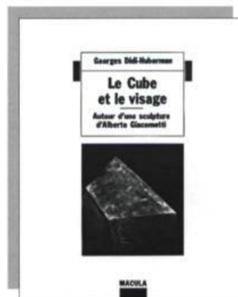
GEORGES, DIDI-HUBERMAN. Le cube et le visage. Autour d'une sculpture d'Alberto Giacometti. Macula, Paris, 1993, 243 pages.

À la suite de l'exposition Giacometti, présentée l'été dernier au Musée des beaux-arts de Montréal, quoi de plus normal que de vouloir entrer de nouveau dans l'intimité de cet artiste qui nous a laissé, à travers ses têtes sculptées et ses portraits dessinés ou peints, une œuvre obsessive et bien étrange — étrange parce qu'obsessive — eu égard à sa recherche initiale d'une présence incertaine, travaillée par l'absence. À la poursuite de cet «anthropomorphisme paradoxal»,