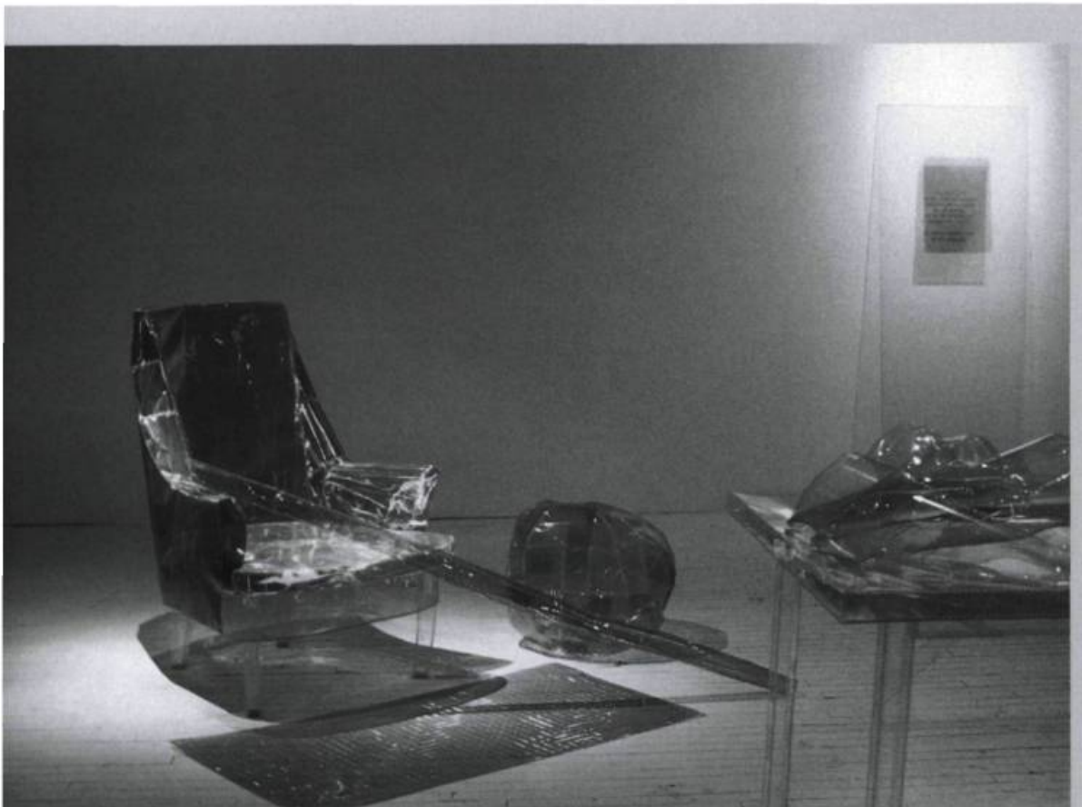
MARIE-CHRISTIANE MATHIEU, Salon Borges , 1998. Pellicules holographiques cousues.

grant, dans son exploration des œuvres, les sens de la vision et de la kinesthésie afin de voir s'animer l'œuvre, se révéler, ou se déployer devant lui les couleurs fuyantes du spectre lumineux. Dans le cas d' Artefacts , ce n'est qu'en adoptant un point de vue particulier sur le cadre que le spectateur verra surgir de la pellicule holographique l'image de la tasse. S'il se déplace hors du champ de projection de l'hologramme, celui-ci verra, comme par magie, disparaître l'image. Avec Comment faire disparaître un objet : mode d'emploi , l'artiste installe trois grandes plaques de verre rectangulaires sur lesquelles apparaissent des images ou des textes gravés et des hologrammes, obligeant le spectateur à réaliser un certain parcours, tantôt en s'approchant pour lire les inscriptions et voir l'hologramme se révéler, tantôt en s'éloignant pour discerner un autre élément. Dans ses productions plus récentes, dont l'œuvre multimédia Ou-Topos , la