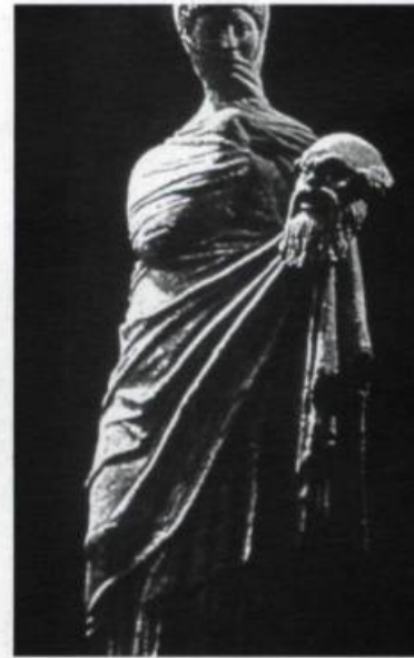
Femme voilée. Statuaire grecque. Pierre sculptée/Sculpted stone. V e siècle av. J.-C.

Throughout history, the issue has haunted theoreticians and historians, if not artists, for reasons related in particular to a sense of propriety. That is, we have often superimposed the concept of "nakedness" on that of the "nude." 1 A careful