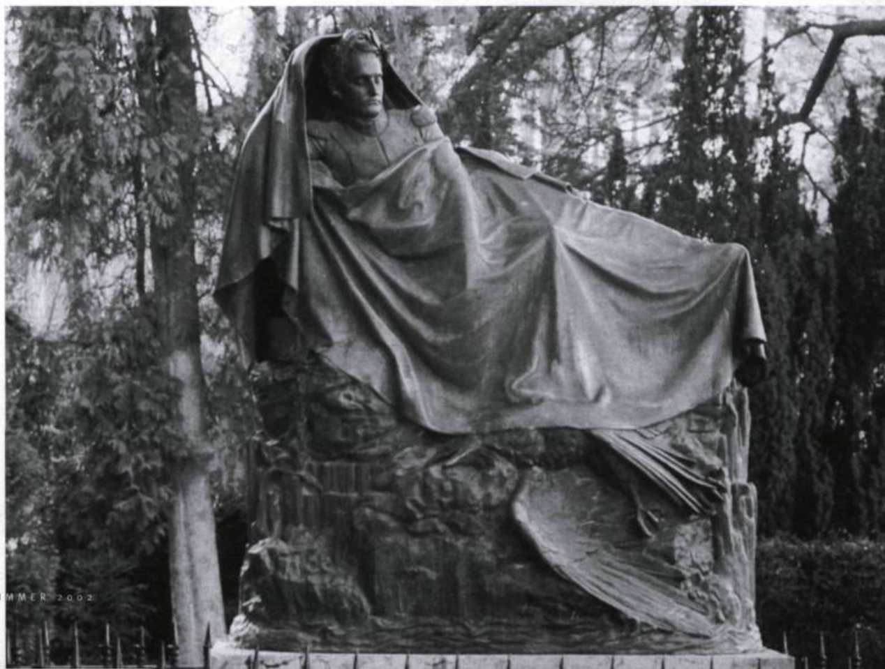
FRANÇOIS RUDE, Napoléon , 1845-1847. Bronze.