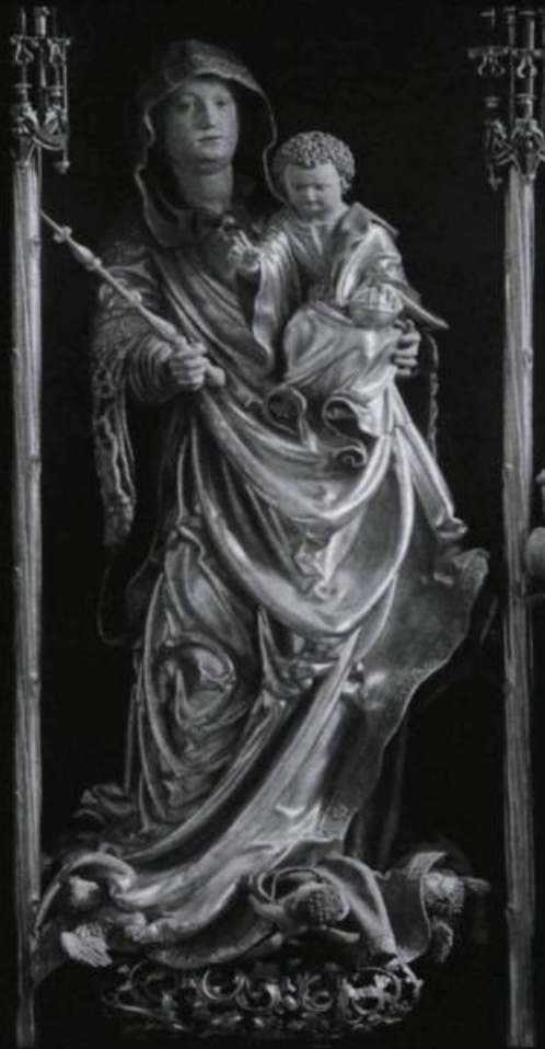
HANS LEINGERGER, Vierge à l'Enfant , c. 1511-1514. Bois polychrome.