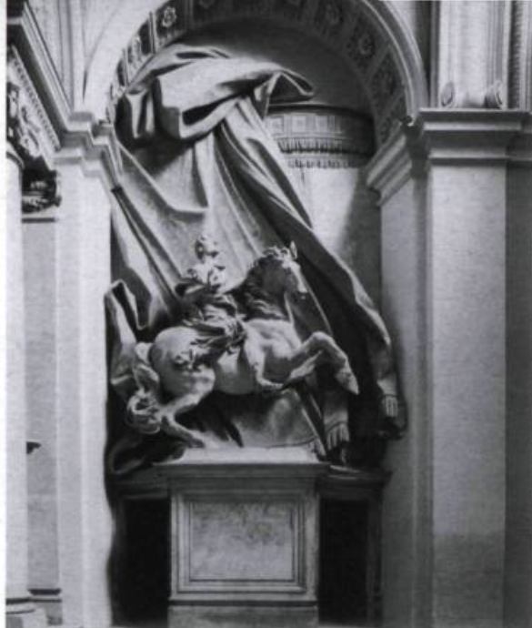
GIAN LORENZO BERNINI, Constantin , c.1663-1670. Marbre et draperie de stuc peint / Painted marble and stucco drapery.

respectant les coutumes de différentes cultures, de nouveaux questionnements éthiques et esthétiques ont surgi et sont encore à résoudre.