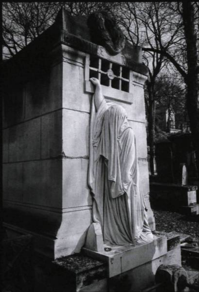
ANTOINE ETEX, Tombeau de la famille Raspail , 1854. Marbre. Cimetière du Père Lachaise, Paris.