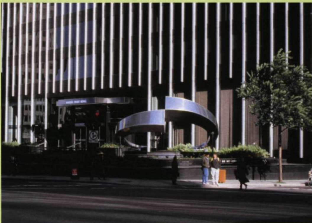
ALAN STOREY, Urban Language , 1992. Aluminium, acier inoxydable, système hydraulique, sons (voix ambiantes) / Aluminum, stainless steel, hydraulics, sound (voice / ambient). 3.6 x 5.4 x 7.3 m. Maison Royal Trust Plaza, Montreal.

Urban Language (1992), created for the Maison Royal Trust Plaza on Boulevard René Levesque in Montreal, remains one of Storey's most successful and succinct commissions. Its graceful aluminum and stainless steel forms, the gradual hydraulic movement upward and downward, and the dramatic site all add to the sculpture's shiny, urbane, almost futurist allure. The crescent-shaped parts of Urban Language are reminiscent of two of Storey's other sound-related works: Head Gear , a helmet with two hearing horns that took in environmental noise then reversed the sounds from the right ear to the left and vice