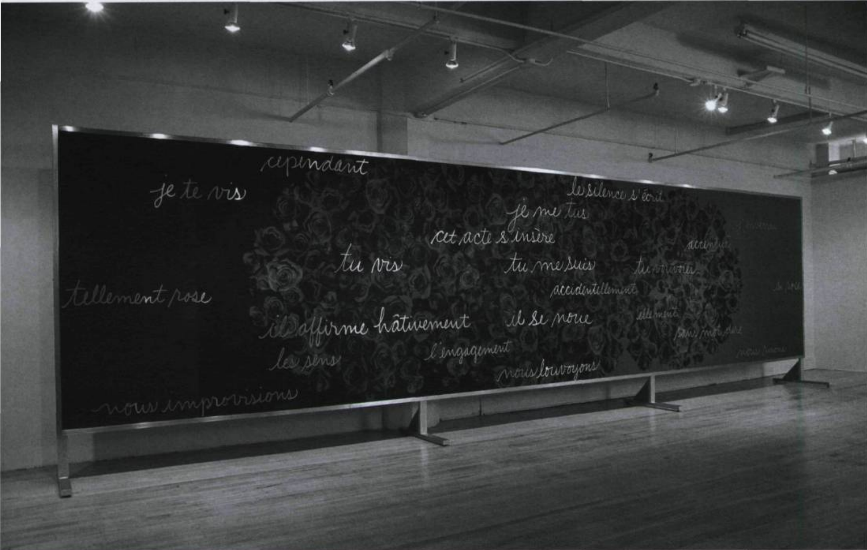
LUCIE DUVAL, Caisse de résonance ou l'hypocrisie de la prose , 2003. Détail de l'installation. Aluminium, bois, tirages numériques, peinture à tableau.