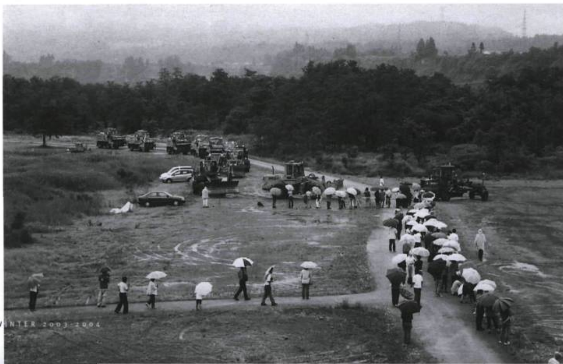
MIERLE LADERMAN UKELES, Snow Worker's Ballet , 2003.