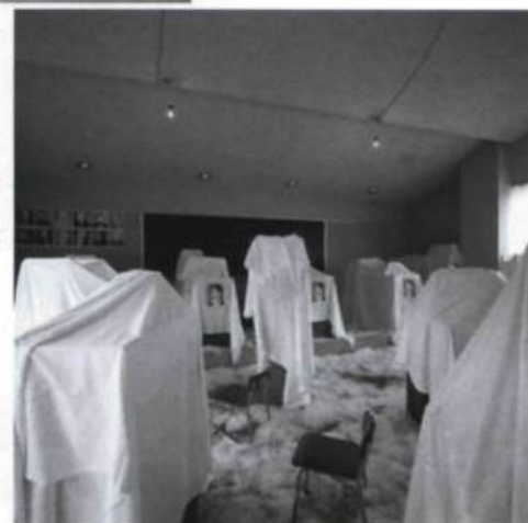
CHRISTIAN BOLTANSKI et JEAN KALMAN, Voyage d'été , 2003.