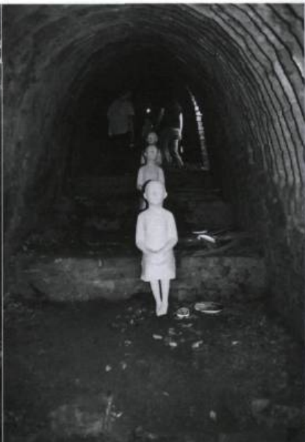
CAI GUO QIANG, Dragon Museum of Contemporary Art , 2000. Briques, four. 35 x 2,5 x 2,5 m.