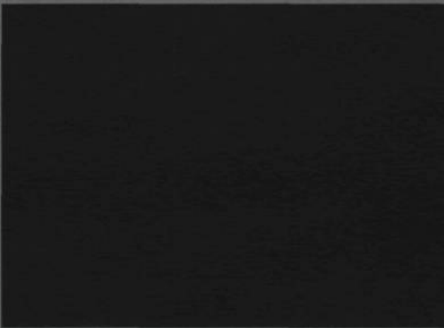
MATHIEU BEAUSÉJOUR, extrait de la série / from the series of Image Média / Media Image , 2004. Anti-© Internationale Virologie Numismatique / Mathieu Beauséjour, 2004.

In the tradition of what the artist calls "semiotic terrorism," he slipped a black rectangle onto the pages of the magazine. This gesture of "blocking out" with black signifies both Censorship and Anarchy, and is presented as an act of contextualized resistance. The presence of this black rectangle also enigmatically prefigures a future intervention in conjunction with the event Arttexte Information Centre is organizing in the fall of 2004.