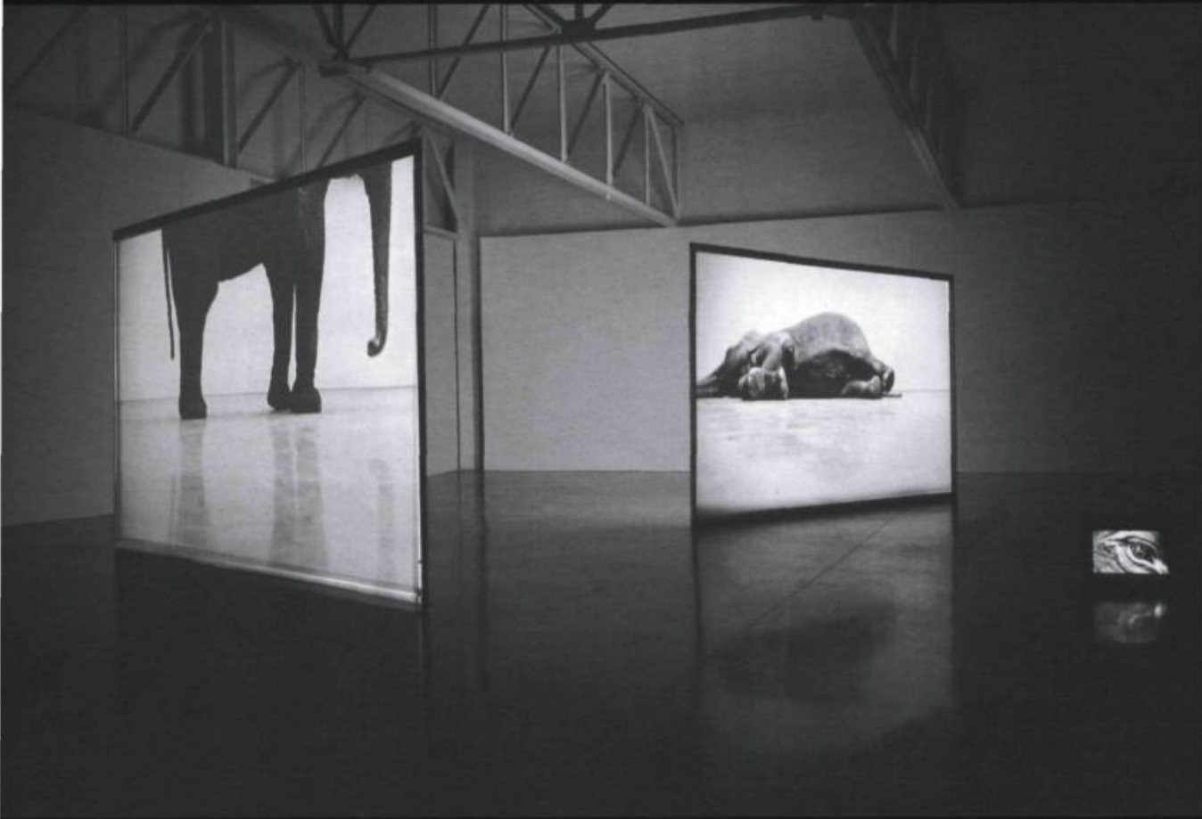
DOUGLAS GORDON, Faire le mort . En temps réel , 2003. Trois vidéos numériques, disques, lecteur de DVD, vidéo projecteurs, écrans de projection, moniteur. Installation de dimensions variables. Musée des beaux-arts du Canada.