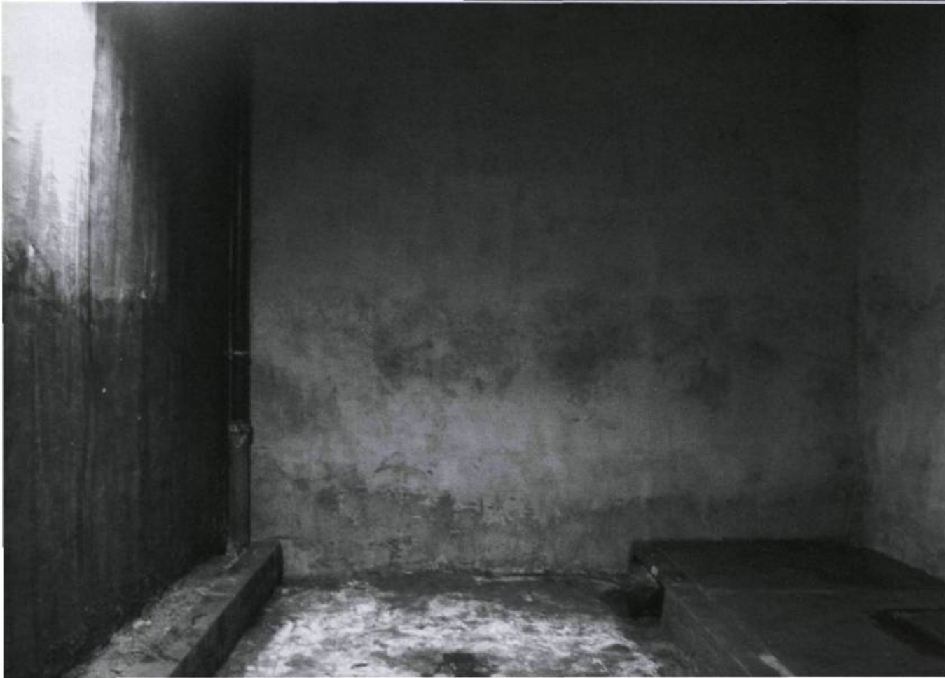
GREGOR SCHNEIDER, 517 West 24th , 2003. Acier, fer, ciment, bois, plâtre, huile à moteur, graisse minérale, peinture acrylique, laque, vase, lampadaire, viande, urine et bactéries diverses. Diamètre extérieur : env. 4,1 x 13,7 x 4,5 m.