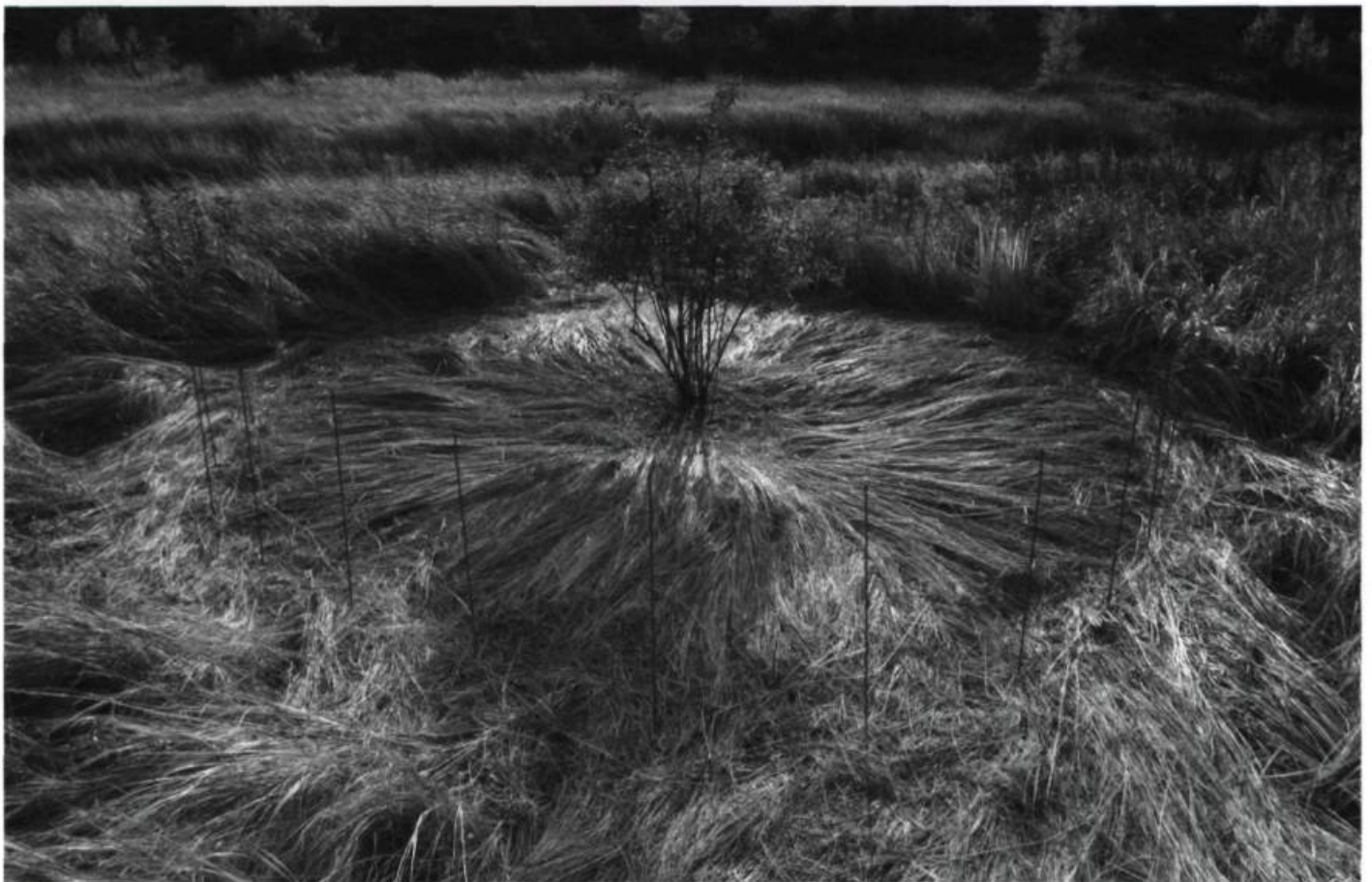
Fernande FOREST, Je rose, je bleu, je fleur dans tes yeux , 2004. Rosier palustre, grelots, spartine pectinée, goujons de bois peints et fruits du rosier.

Quoi qu'il en soit, toute l'entreprise ne manquait pas de cohérence sur le papier, et les résultats sur le terrain étaient souvent plus que satisfaisants. Glissons sur la proposition évolutive de Larivée — bien ficelée, comme d'habitude, dans sa façon d'entrecroiser les complicités scientifiques, les intentions écologiques et la dimension proprement poétique —, prometteuse mais qu'on ne pourra vrai-