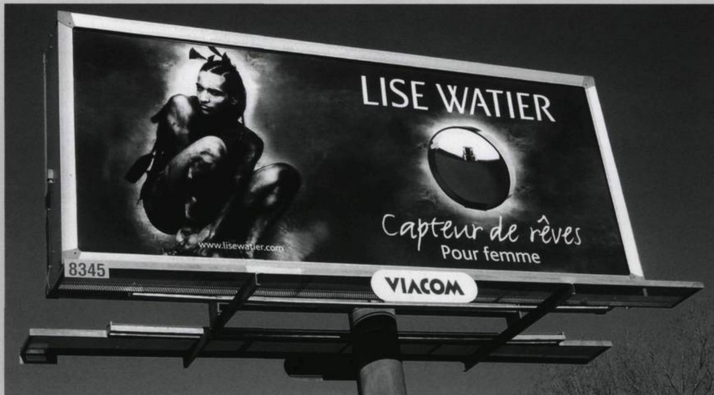
Panneau d'affichage de Lise Watier / Billboard from Lise Watier.

gènes avant l'arrivée des Européens —, contribuant ainsi à créer un stéréotype qui persiste encore aujourd'hui. Ce n'est qu'un siècle plus tard qu'on commencera à ressentir un malaise devant cette image de l'autochtone et toute la signification qu'on lui prête.