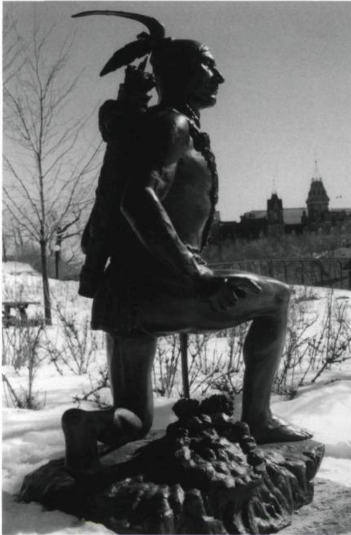
Anishinabe Scout/ L'Éclaireur Anishinabe, Major's Hill Park, Ottawa.