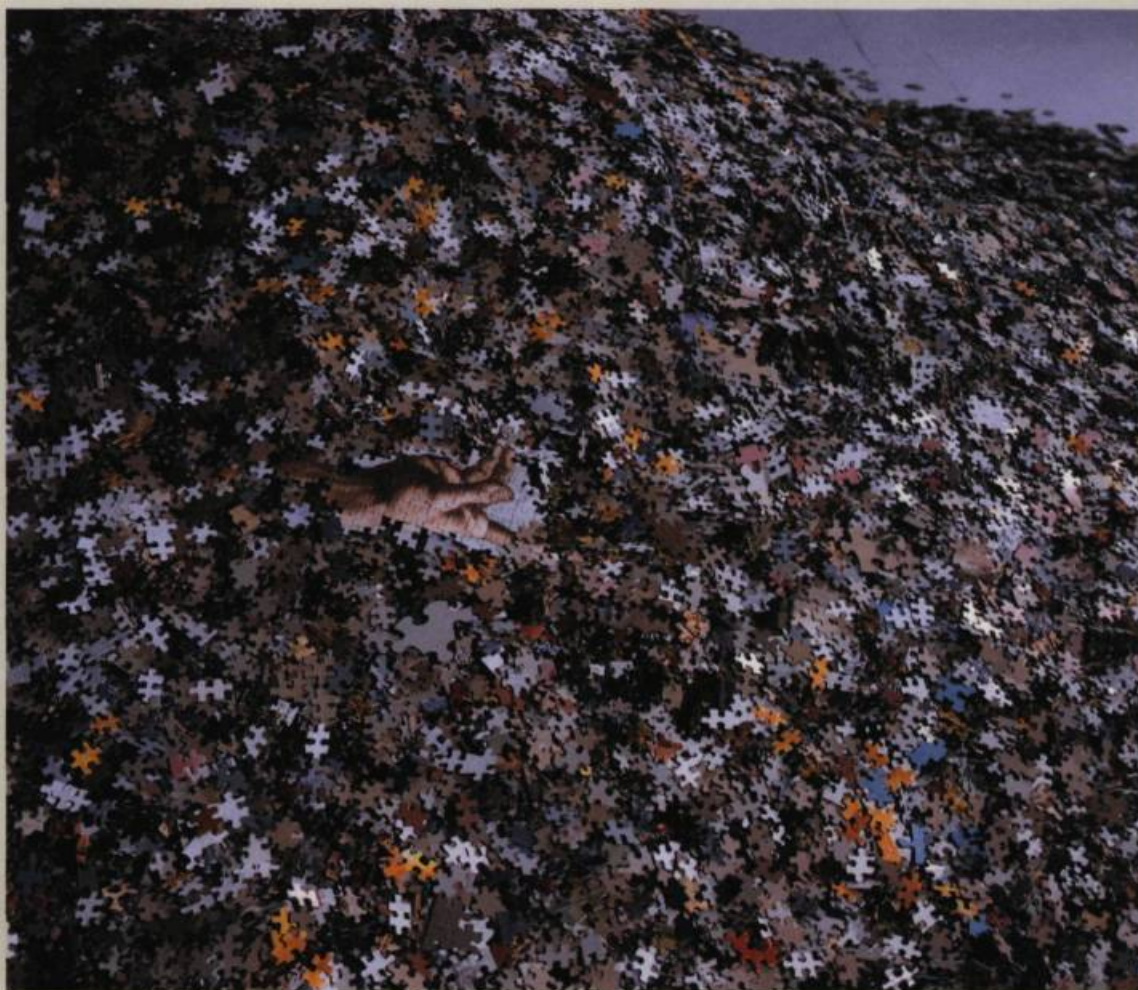
Jean-Marc MATHIEU-LAJOIE, Jardin à recomposer , 2005.

saisit rapidement que plusieurs œuvres récentes évitent toute problématique scopique et toute mise en question du contenu des images. Récemment, la recherche s'enrichit d'autres possibles, empruntant à l'occasion d'autres visages, des explorations nouvelles et de nouveaux supports qui viennent mettre en lumière la cohérence d'un travail dépassant l'effet premier de la trouvaille. L'ouverture à d'autres types de systèmes de construction de l'image permet en outre de mieux saisir l'essence même de cette lubie des systèmes. Des paquets de crayons au profil plat ont notamment donné lieu à de nouvelles fouilles. Collés les uns aux autres, ils composent des images provenant de cahiers à colorier en lien direct, donc, avec leur support. Ils constituent, dans leur alignement, une trame fine et facile à distendre. La sédimentation à la verticale des images rappelle l'effet de balayage des écrans cathodiques ou télévisuels.