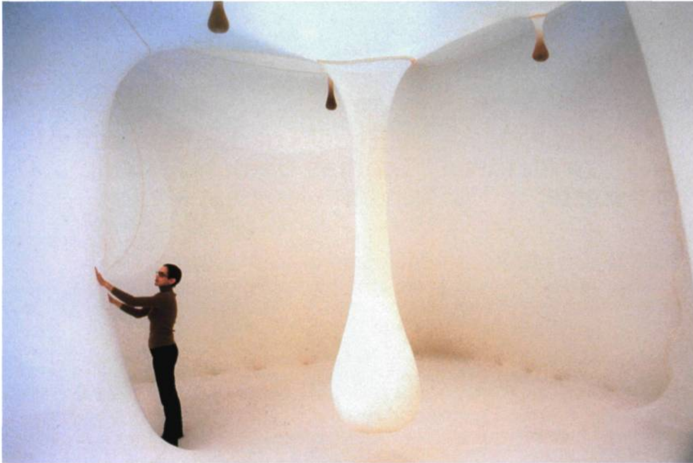
Ernesto NETO, Nude Plasmic , Installation, 1999. Tissu, sable, styromousse et lavande/ Stocking, sand, styrofoam and lavender. Dimensions variables.