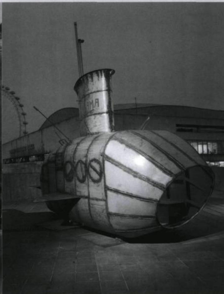
PANAMARENKO, U-Kontrol III , 1972. Collection & Copyright: Musée d'art Moderne de la Ville de Paris, Paris.