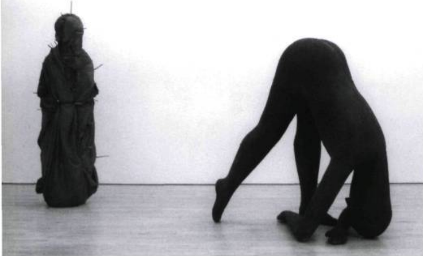
visage: un masque rehaussé de deux trous pour les yeux et d'une fente pour la bouche ( The man and the child , 1994).

En somme, il apparaît que chaque œuvre instaure un récit, que le sculpteur veille ensuite à déjouer, pour contrarier toute