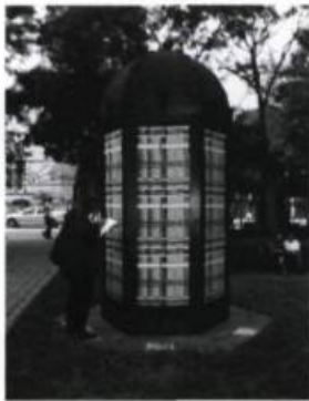
Derek SULLIVAN, Kiosk , 2005. Wood, paint, printed material, 365.7 x 162.5 x 162.5 cm.

The Toronto Sculpture Garden, a playground of art self-contained in iron gates at Church and King Street East, is a strange venue for art. This is an outside gallery, so the weather and vandalism sometimes contribute to the artwork itself, and permits more barriers to be crossed, unlike the supervised and controlled gallery spaces we're so accustomed to.