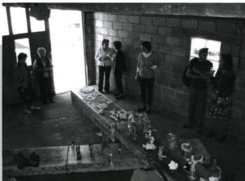
Exposition MIKADO, 2007. Détail. Centre international art, nature et paysage de Charlevoix.