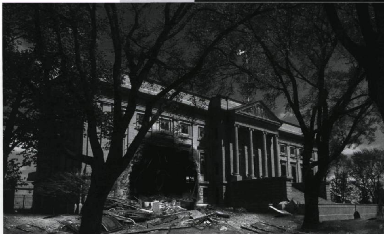
Michel de BROIN, Trou , 2006. Impression au jet d'encre.