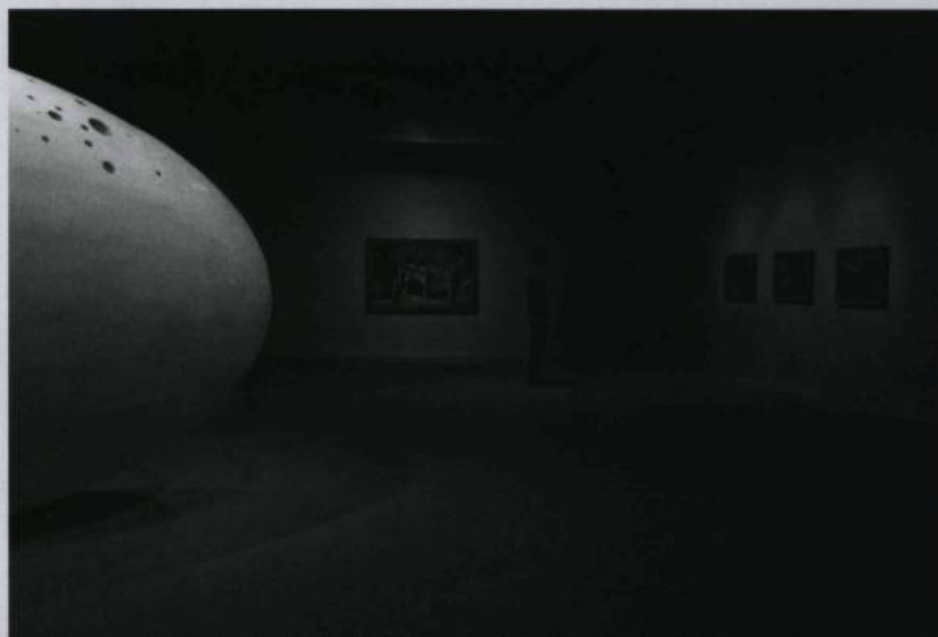
Vue de l'exposition Michel de BROIN. Machinations présentée à la Galerie de l'UQAM du 19 octobre au 24 novembre 2007.