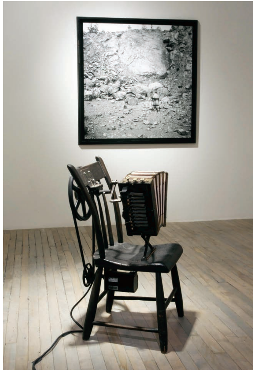
→ Lyne LAPOINTE, Barrage de castor , 2005. Photographie noir et blanc de Marik Boudreau, impression au jet d'encre/Black and white photo by Marik Boudreau, ink jet print. 165 x 114,3 x 6,9 cm.

Until now, I have deliberately left certain fuzziness in the terms I've been using, notably in the words instruments and devices. Critical language is not very precise in this area and one speaks readily of apparatuses when one wants to designate some assemblage of diverse technologies or machines. The notion of the apparatus—in particular—possesses a history that, if partly tied to technology or devices, is first and foremost concerned with the construction, conditioning and positioning of the