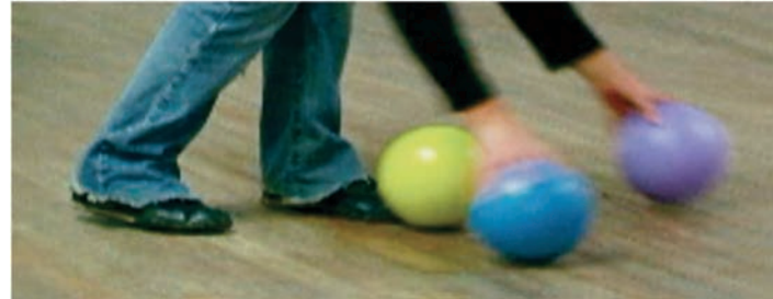
Marc FOURNEL, Tontauben , 2004. Installation sonore interactive/interactive sound installation.

allure communicationnelle et s'engagent dans un dialogue non verbal avec d'autres joueurs ; l'espace ludique devient collectif. Les œuvres de Fournel, relevant plus de la libre improvisation que du respect de règles strictes, seraient aussi à classer selon l'une des quatre catégories de jeux que Roger Caillois définit et qu'il appelle Ilinx : la poursuite du vertige qui consiste en une tentative de détruire pour un instant la stabilité de la perception et d'infliger à la conscience lucide une sorte de panique voluptueuse. Caillois ne manque pas de souligner que « règle et vertige sont décidément incompatibles 4 ».