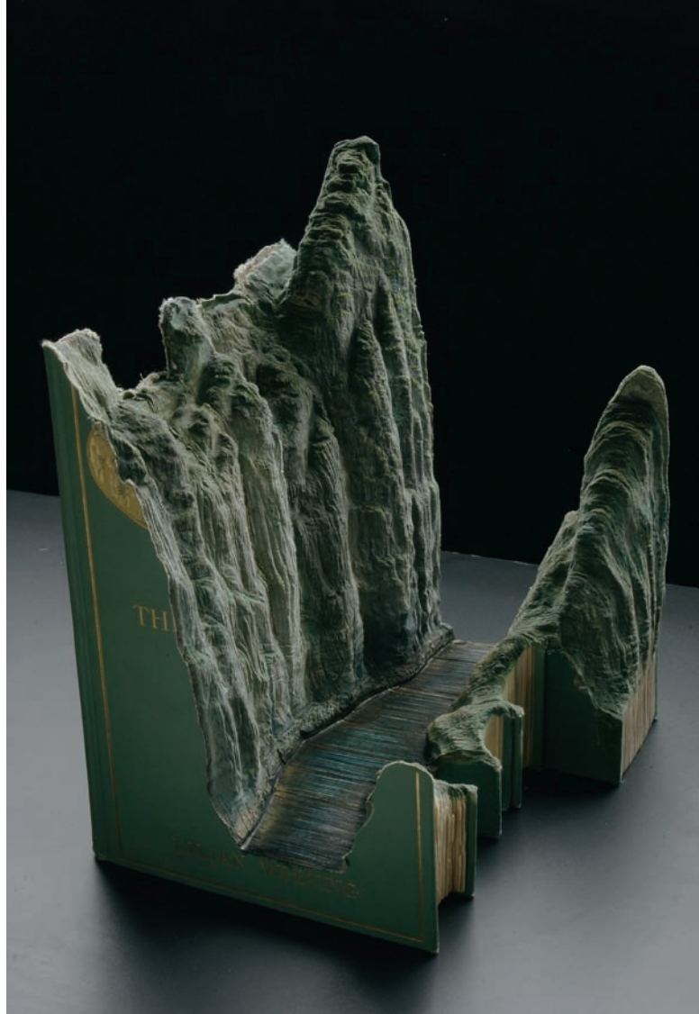
Guy LARAMÉE, Jade , 2010. Livres anciens érodés, encres, dorure sur tranche. 33 x 25,4 x 25,4 cm. Photo: G. Laramée.

Guy LARAMÉE, Ryōanji , 2010. Détail. Dictionnaire japonais sculpté, agrafe de cuivre. 23 x 15 x 10 cm. Photo: G. Laramée.