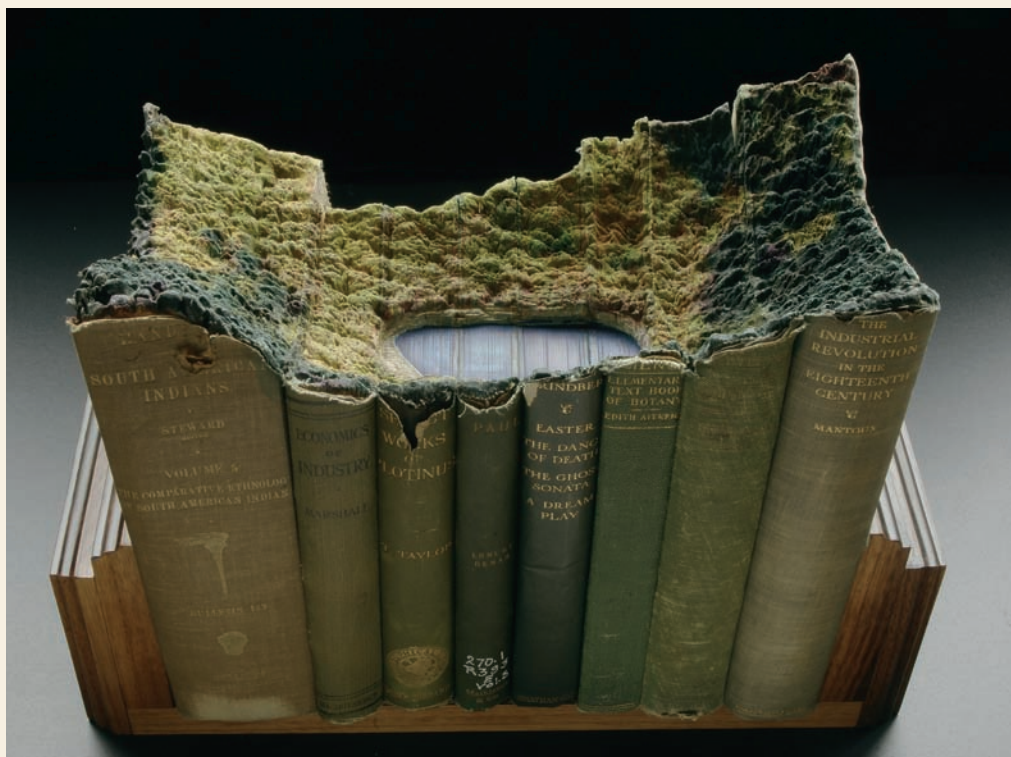
Guy LARAMÉE, Thoreau , 2010. Livres anciens érodés, encre, noyer. 33 x 25 x 15 cm.

Temps figé. Oui, effectivement, je m'intéresse à un temps lent, très lent. Certes, le médium (sculpture, peinture ou installation) sous-entend des «objets» laissés là, et c'est le spectateur qui doit les pénétrer: c'est lui ou elle qui injecte le temps. C'est la même chose dans les arts du temps, mais seuls les arts de l'inanimé peuvent nous faire prendre pleinement conscience du rôle du spectateur dans la constitution du spectacle. Ensuite, il y a le niveau des sujets. Les sujets aussi sont fixes. Sauf exception, je m'interdis le recours à des scènes en mouvement. C'est donc comme si nous étions devant une scène réelle, immobile. Les gens m'ont dit qu'ils avaient l'impression que les nuages de brume bougeaient... C'est là où je vais. Dans l'état de mes recherches, je dirais que la