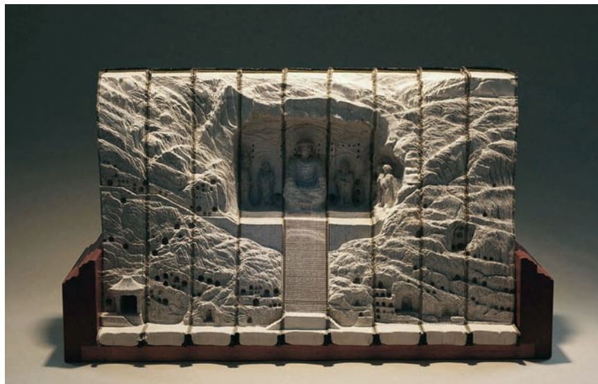
Guy LARAMÉE, Longmen , 2010. Encyclopédies érodées, acajou. 33 x 56 x 24 cm.

Alexandre NUNES est un artiste en arts visuels. Il poursuit présentement un Majeur en sculpture à l'Université Concordia et travaille pour le magazine Espace .