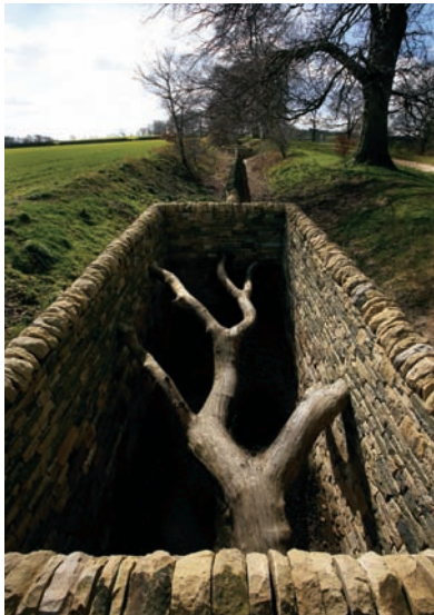
Andy GOLDSWORTHY, Hanging Trees , 2006.

Best known for his early collaboration on New Milestones with Common Ground (1986-87), and for the Eden Project in Devon, a granite seed cone forming the central focus of a building, Randall-Page's YSP show of some 50 pieces, closing as David Nash's show was being setting up, captured the essence of his nature-based aesthetic. Design drawn from nature and rendered into atypical ultraforms, Fructus and Corpus (2009), both two metres high and 13 tons in weight, draw on fruit and coil forms, but evolve from them. Another Randall-Page piece in the gallery has dramatic white bubble-pack-like surfaces. Enigmatic as sculpture, Randall-Page's sculptures are models, constructs, and several of