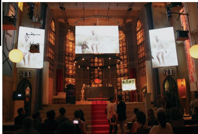
Christoph SCHLINGENSIEF, A Church of Fear vs. The Alien Within , 2011. Pavillon de l'Allemagne.