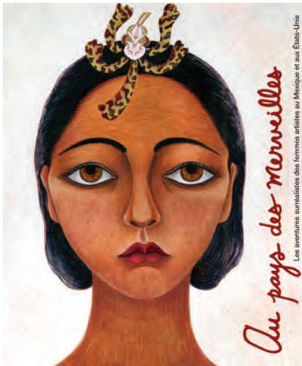
Aux pays des merveilles. Les aventures surréalistes des femmes artistes au Mexique et aux États-Unis (sous la direction d'Ilene Susan Fort et de Tere Arck), Éd. Los Angeles County Museum of Art et DelMonico/Prestel, traduit de l'anglais par Jean-François Allain, 2012, 256 p., ill. couleurs.

Ce magnifique ouvrage est la version française du catalogue qui accompagne une intéressante exposition, présentée du 7 juin au 3 septembre 2012, au Musée national des beaux-arts de Québec. Ayant pour thème la production de quarante-huit femmes artistes qui ont été inspirées par le surréalisme, cette exposition est organisée par le Museo de Arte Moderno de Mexico (MAM) et le Los Angeles County Museum of Art (LACMA 1 ). L'idée de rassembler près de cent quatre-vingts œuvres provenant de soixante-quinze collections publiques et privées a émergé d'une rencontre fortuite entre Tere Arck et Ilene Susan Fort, deux conservatrices passionnées par le surréalisme tel qu'il se manifeste dans l'œuvre des femmes du Mexique et des États-Unis. Puisqu'une telle exposition n'a jamais été proposée au public jusqu'à ce jour, on comprend l'importance de cette publication qui, en plus des textes de Arck et de Fort, rassemble ceux d'auteurs chevronnés comme Dawn Ades, Whitney Chadwick, Rita Eder, Teri Geis et Salomon Grimberg. Ayant pour sujets l'inconscient et l'identité féminine, éros et thanatos, l'art des cultures indigènes, les rituels chamaniques et la photographie, leurs contributions nous proposent diverses analyses démontrant l'apport indéniable des femmes artistes à ce mouvement.