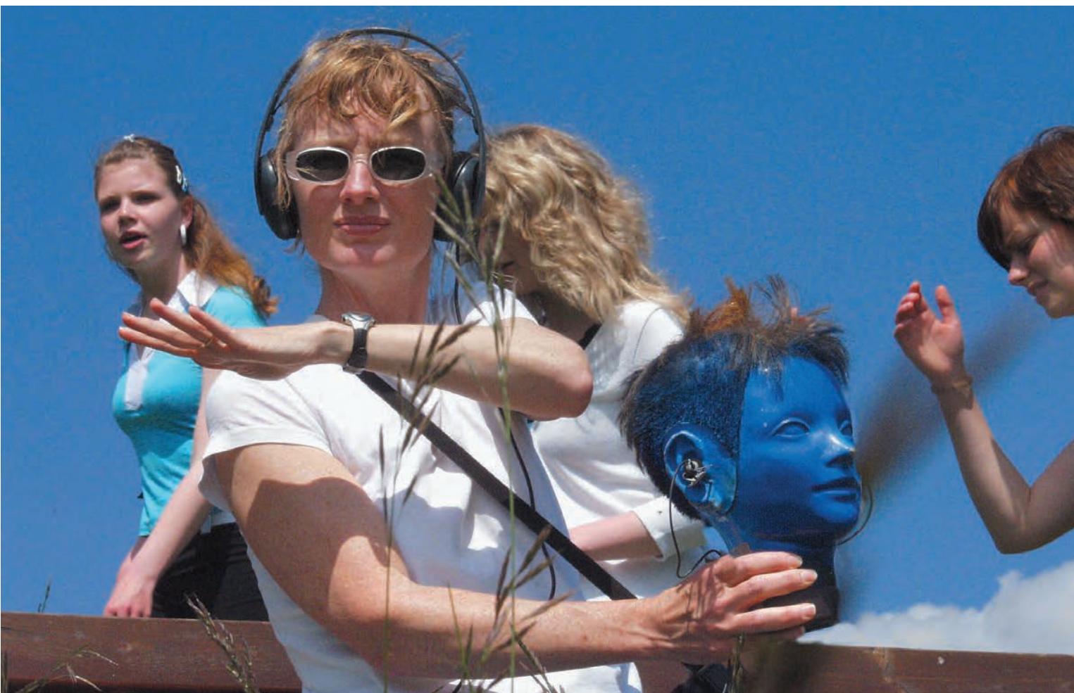
Janet CARDIFF & George BURES MILLER, Jena Walk (Memory Field) , 2006. Commandé par le Culture Department de la Ville de Jena, Allemagne/Commissioned by the Culture Department of the City of Jena, Germany.

Beyond media overkill, the political dimension of public art also raises questions regarding the methods of selecting work, notably the highly