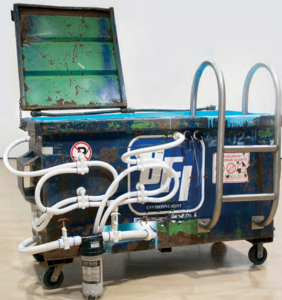
Michel DE BROIN, Monochrome bleu , 2003. Conteneur à déchets, eau, pompe, filtre, lumière et système de chauffage. 218 x 225 x 158 cm. Collection du Musée national des beaux-arts du Québec, Québec. L'intérieur d'un conteneur à déchets usagé est imperméabi- lisé avec de la matière bleue. Dotée d'une pompe et d'un système de filtration, l'œuvre assure la pureté et l'accessibilité de son contenu: plus de 1000 litres d'eau filtrée et chlorée. Des jets puis- sants stimulent l'expé- rience sensorielle. Photo: M. DE BROIN.

Le cas de Tenir sans servir c'est résister (2013), une métaphore de la résistance électrique que de Broin élabore depuis 1998 avec